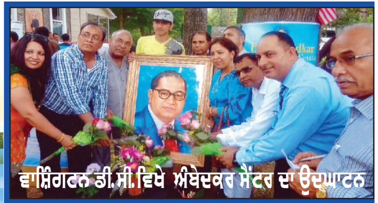
ਵਾਸ਼ਿੰਗਟਨ ਡੀ.ਸੀ. ਵਿਖੇ ਅੰਬੇਦਕਰ ਸੈਂਟਰ ਦਾ ਉਦਘਾਟਨ

ਮੁੱਖ ਸੰਪਾਦਕ : ਪ੍ਰੋ. ਕੁਮਾਰ ਚੰਬਰ ਸੰਪਰਕ : 510-219-8920 ਫੈਕਸ : 916-238-1393 E-mail : deshdoaba@yahoo.com ਸੰਪਾਦਕ : ਤਰਸੇਮ ਜਲੰਧਰੀ