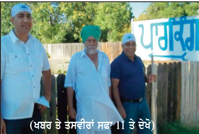
(ਖਬਰ ਤੇ ਤਸਵੀਰਾਂ ਸਫਾ 11 ਤੇ ਦੇਖੋ)